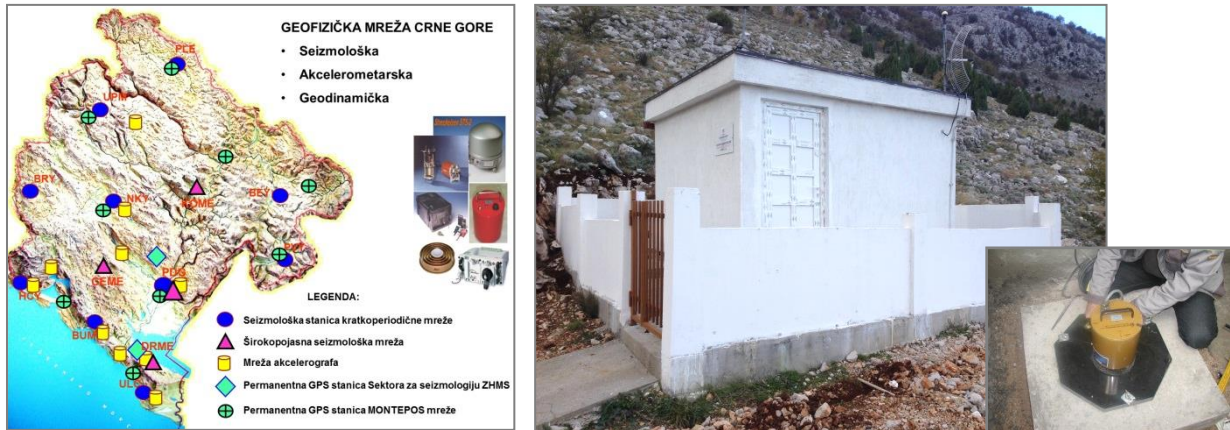
Struktura Mreže geofizičkih stanica Crne Gore (seizmološka, akcelerografska i permanentna GPS) /lijevo/, primjer izgleda novog objekta automatske seizmološke stanice (selo Dračevica na Skadarskom jezeru) /u sredini/ i proces instaliranja seizmičkog senzora na piadestalu u dubokoj šahti ispod tog objekta (desno).

Za te potrebe izvršen je iskop šahti u stijenskoj masi, dubine oko 3 metra, izvedeno betonsko-armaturni radovi, izgrađen manji građevinski objekat za smještaj komunikacione opreme, baterijskog napajanja i fizičko obezbjeđenje uređaja. Ove stanice su puštene u funkciju krajem izvještajnog perioda i sada funkcionišu u sistemu automatskog seizmičkog monitoringa teritorije Crne Gore i regiona.