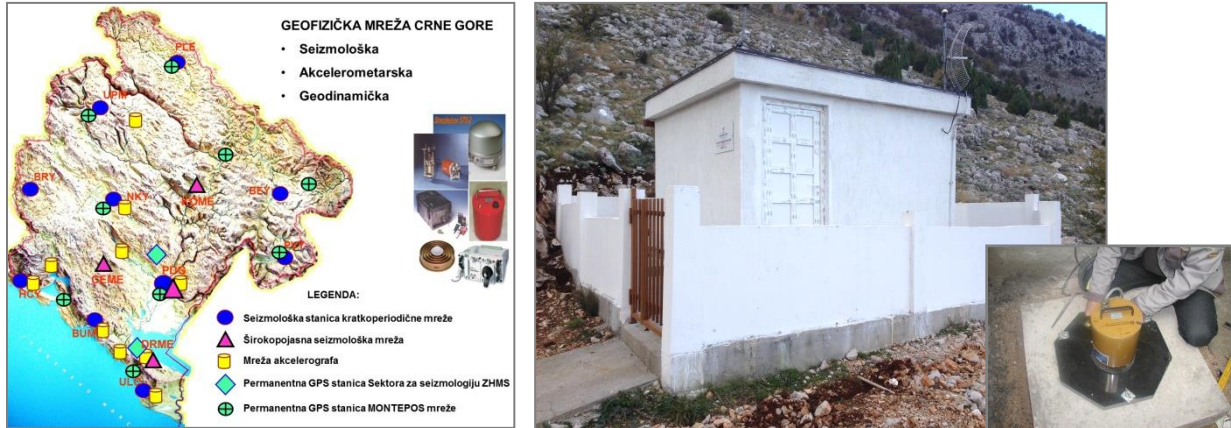
Struktura Mreže geofizičkih stanica Crne Gore (seizmološka, akcelerografska i permanentna GPS) /lijevo/, primjer izgleda novog objekta automatske seizmološke stanice (selo Dračevica na Skadarskom jezeru) /u sredini/ i proces instaliranja seizmičkog senzora na piadestalu u dubokoj šahti ispod tog objekta (desno).

Za te potrebe izvršen je iskop šahti u stijenskoj masi, dubine oko 3 metra, izvedeno betonsko-armaturni radovi, izgrađen manji građevinski objekat za smještaj komunikacione opreme, baterijskog napajanja i fizičko obezbjeđenje uređaja. Ove stanice su puštene u funkciju krajem izvještajnog perioda i sada funkcionišu u sistemu automatskog seizmičkog monitoringa teritorije Crne Gore i regiona.